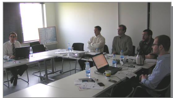
Session de formation au sein de KEREVAL

PSA et VALEO sont les premiers à en bénéficier. Pourquoi pas vous ? ■