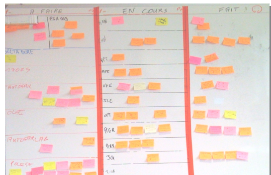
Scrum Board, permettant de visualiser l'état du projet

L'objectif principal de ces méthodes agiles est d'impliquer davantage au quotidien le client et l'équipe afin d'éviter des incohérences entre le besoin initial et le produit livré.