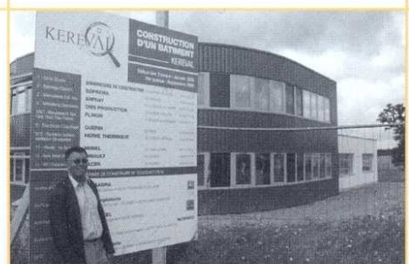
Les salariés de Keréval intégreront fin septembre 500 m 2 de nouveaux locaux construits à Thorigné-Fouillard près de Rennes.

D'autres partenaires contribuent au financement de l'entreprise : Oséo